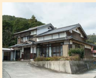
空き家となっていた民家でシェアハウス